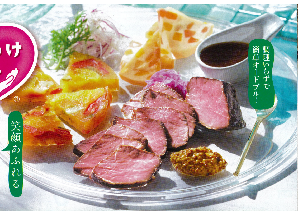
※「こころわけ」は、こころ遣いと小分けを合わせた造語です。